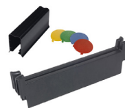
KIT BARRE SÉPARATRICE POUR TRI SÉLÉCTIF Réf : 910880