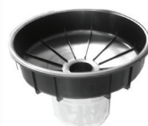
Entonnoir obturateur anti-débordement réf. 502035 (inclus)

(Photos et données techniques non contractuelles et modifiables sans préavis.)