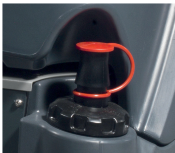
Système flexifill : flexible extensible pour faciliter le remplissage du réservoir